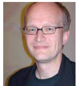
Andreas Platthaus Frankfurter Allgemeine Zeitung